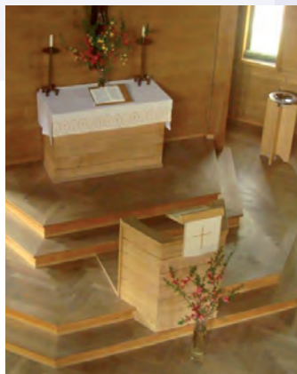
Heilandskirche in Dornbirn

Die Bezeichnung „Helvetisches Bekenntnis“ leitet sich von einem religiösen Schreiben ab, das der Reformator Heinrich Bullinger, Nachfolger Zwinglis in Zürich, im Jahr 1562 als Privatbekenntnis geschrieben und 1566 als gesamtschweizerisches Bekenntnis herausgegeben hat. In Österreich bekennen sich ca. 14.000 Gläubige zum Helvetischen Bekenntnis. Sie besteht aus neun Gemeinden, deren vier in Vorarlberg, drei in Wien, eine in Linz und eine in Oberwart liegen. Die Kirche zählt zu den staatlich anerkannten Religionsgemeinschaften und