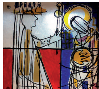
1. Station: Jesus wird zum Tode verurteilt

Besonders gestaltete Kreuzwegandachten finden an den folgenden Freitagen , jeweils um 17 Uhr , in der Stadtpfarrkirche statt: Freitag, 18. März – Freitag, 25. März – Freitag, 1. April