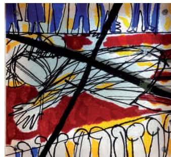
3. Station: Jesus fällt zum ersten Mal unter dem Kreuz