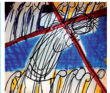
2. Station: Jesus nimmt das Kreuz auf seine Schultern