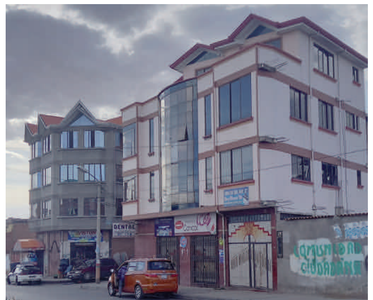
Das Waisenhaus in El Alto