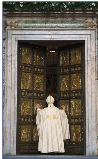
Öffnung der Heiligen Pforte im Petersdom

Das Jubeljahr steht unter dem Leitwort Pilger der Hoffnung . Papst Franziskus führt in der so genannten Verkündigungsbulle dazu aus: Die christliche Hoffnung besteht genau darin: Im Angesicht des Todes, wo